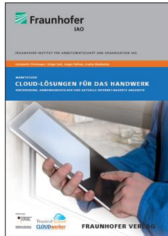
Marktstudie Cloud-Lösungen für das Handwerk

Trusted SaaS im Handwerk: flexibel – integriert – kooperativ