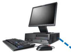
Zugriff im Büro