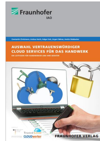
Leifaden für Handwerker

Erhältlich als kostenlose Broschüre oder digital unter http://www.cloudwerker.de